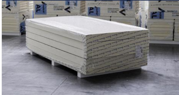
Foto stohu v malém formátu