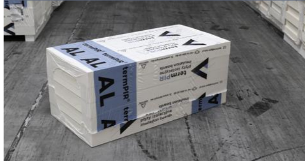
Foto jednoho balíku 1200x2400mm