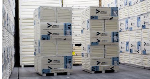
Foto stohu ve velkém formátu