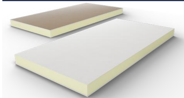
Foto balíku AL/GK